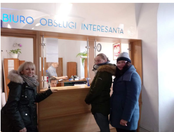
"SAMODZIELNOŚĆ DROGĄ DO SUKCESU" - Luty